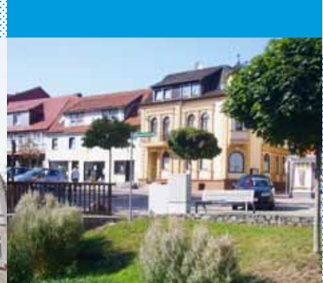
Fachwerk und Giebelarchitektur – typisch für den Luftkurort Bad Sachsa