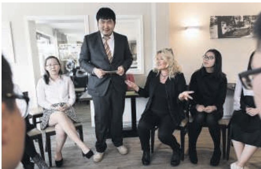
Weichselgartner-Nopper: 'Jasje dicht als je staat, benen stukje uit elkaar'