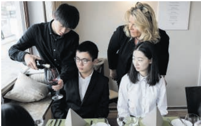
De docente leert Chinese studenten de correcte fleshouding.

Het is een rage in Duitsland. De kinderen naar een etiquettecursus sturen waar ze 'goede manieren' leren volgens de klassieke geboden van Adolph Freiherr Knigge uit de 18de eeuw. 'Je zegt geen gezondheid als iemand niest.'