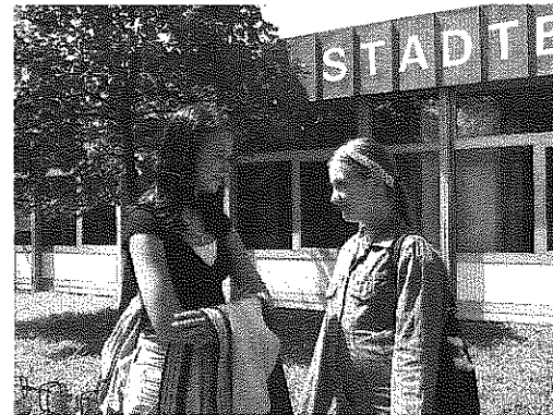
HALBNAH (HN): Die Figur/en wird/werden ungefähr zur Hälfte (bis zur Hüfte) abgebildet.