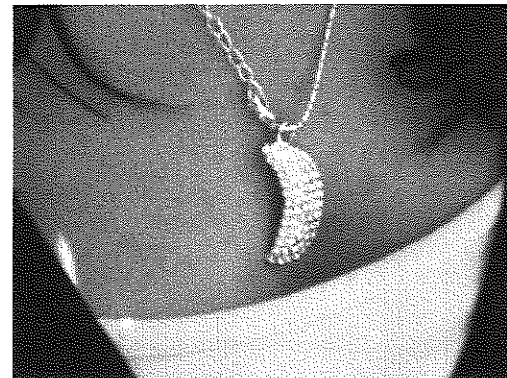
DETAIL (D): Ein bestimmtes Detail wird hervorgehoben.