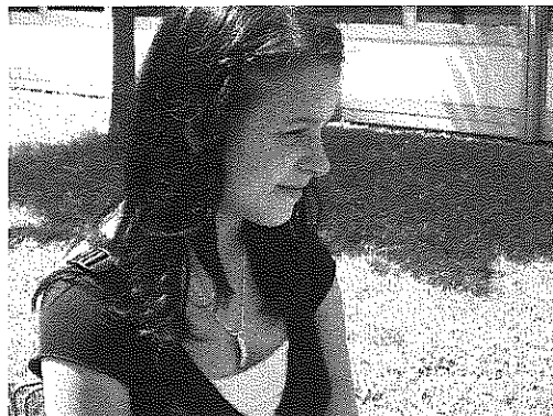
NAH (N): Der Kopf einer Figur steht im Mittelpunkt.